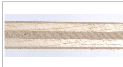
Composición del tablero