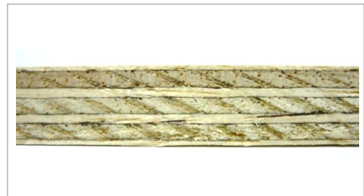
Composición del tablero