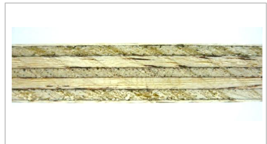
Composición del tablero